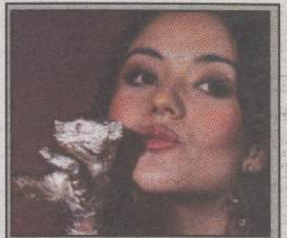
برندگان جشنواره برلین